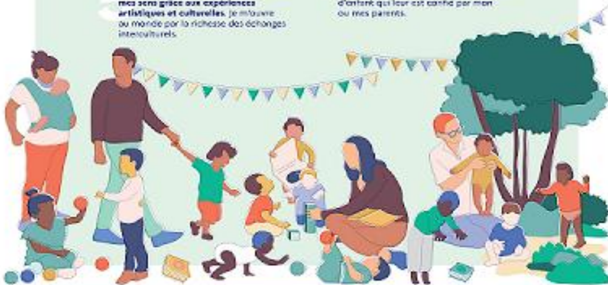
Cette charte a été élaborée par les professionnels de l'Accueil du Jeune Enfant, quel que soit le mode d'accueil, en application de l'article L. 214-10 du code de l'action sociale et des familles. Elle doit être mise à disposition des parents en français dans les langues régionales.

J'ai besoin que les personnes qui prennent soin de moi soient bien formées et s'intéressent aux spécificités de mon très jeune âge et de ma situation d'enfant qui leur est confié par moi ou mes parents.